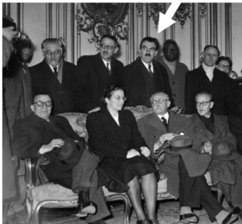
Le Ministère Blum de fin 1946 Léon Blum à côté d'Andrée Viénot, André Philip debout derrière Blum

Sa politique étant perçue comme trop dirigiste par ses camarades de la SFIO, il ne sera pas reconduit dans des fonctions ministérielles après 1947 et perdra son mandat de député du Rhône en 1951.