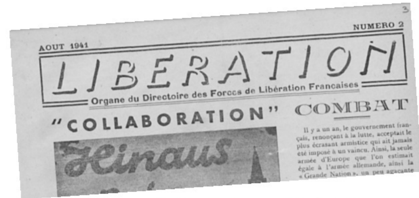
André Philip participe à la publication du journal clandestin Libération

Il collabore au journal de la résistance 'Libération' de la zone sud.