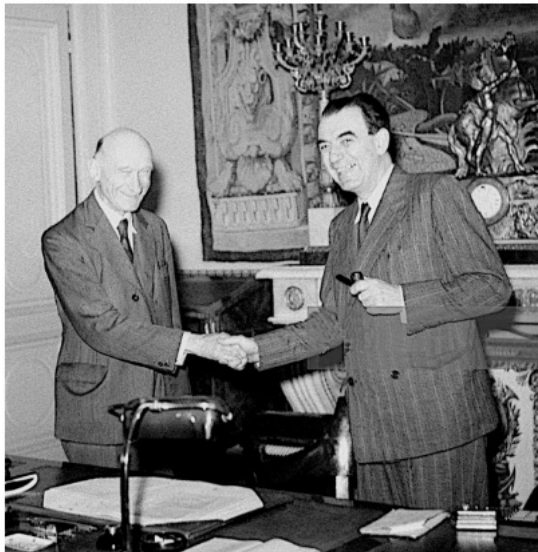
Robert Schumann et André Philip en 1946

Il devient président du Mouvement socialiste pour les Etats-Unis d'Europe. Pragmatique, il est pour la création d'institutions européennes spécialisées afin de créer des solidarités et faire avancer la construction d'une Europe fédérale. Il reconnaîtra en 1966 que les conditions d'une Europe politique ne sont pas réunies.