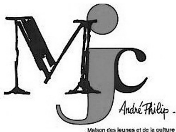
Logo de la MJC André Philip de Torcy (Seine et Marne)

André Philip dès ses premières publications a accordé une très grande importance à l'éducation des travailleurs, l'éducation populaire .