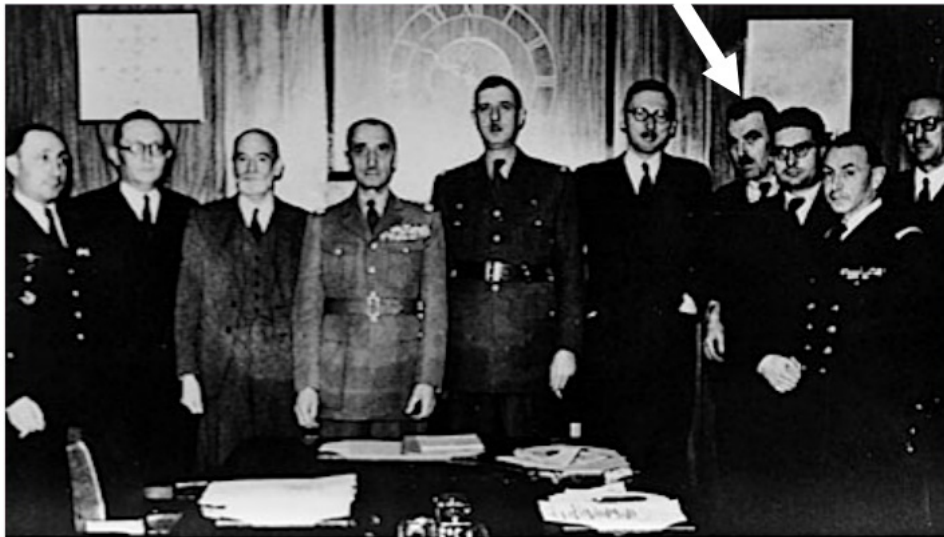
LE COMITÉ NATIONAL FRANÇAIS A LONDRES EN MAI 1943

Allocution d'A.Philip à la BBC le 30/7/1942