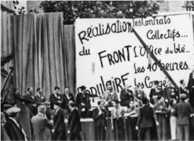
un meeting de soutien au Front populaire

Le député André Philip a participé aux réformes. Membre actif de la Commission des projets des lois sociales il a été rapporteur de la loi des 40 heures de travail hebdomadaire. Il contribue ainsi à la concrétisation de ses idées pour l'amélioration des conditions de vie des travailleurs.