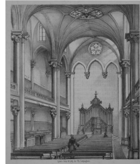
Temple protestant, 10 rue Lanterne à Lyon