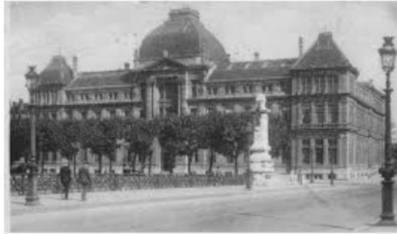
La faculté de Droit de Lyon

Professeur d'économie à l'université, il est apprécié de ses étudiants.