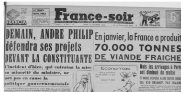
France-soir du 14 février 1946

Il participera à trois gouvernements socialistes comme ministre de l'économie et des finances.